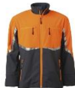
Jacke Forrester 27674